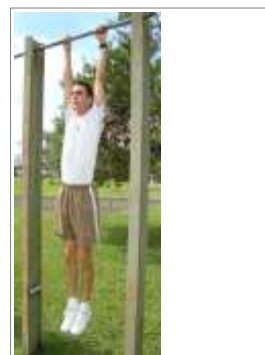
Posição Inicial (1)

A posição de pegada é pronada, (palmas das mãos voltadas para a frente) e correspondente a distância lateral biacromial (dos ombros), braços e pernas estendidas, com o corpo na posição vertical, perdendo contato com o solo(1);