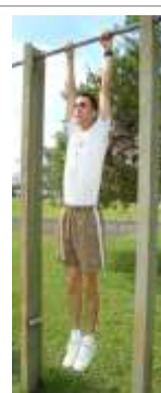
Posição Final (3)