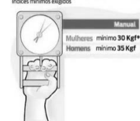
Teste de Dinamometria (Força Muscular) Índices mínimos exigidos

Os procedimentos para a execução do Teste de Dinamometria Manual obedecerão aos seguintes aspectos: O (a) candidato (a) deverá posicionar-se em pé, com afastamento lateral das pernas, os braços ao longo do corpo, o punho e antebraço em posição de pronação, segurando o dinamômetro na linha do antebraço. Na posição indicada, o (a) candidato (a) deverá realizar a maior tensão possível de flexão dos dedos, com a preensão da barra móvel do dinamômetro entre os dedos e a base do polegar. Não será permitida nenhuma movimentação do cotovelo e punho. O (A) candidato (a) terá 3 (três) tentativas sendo estas de contração máxima e que devem ser realizadas de forma alternada, em cada uma das mãos. O resultado a ser considerado será aquele de maior valor e o(a) candidato(a) será considerado(a) APTO(A) ou INAPTO(A).