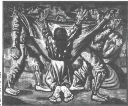
Enterro na Rede – Cândido Portinari

Observe as figuras abaixo para responder a questão 72.