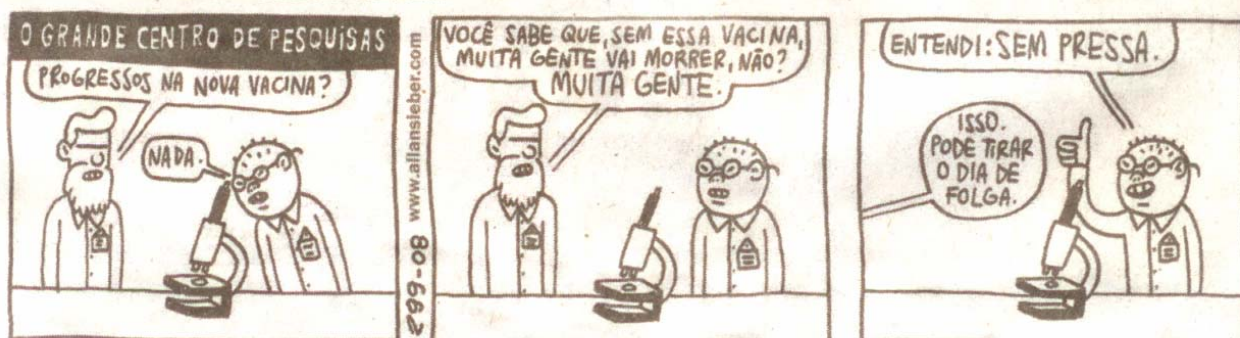
(SIEBER, Allan. Preto no branco/ O grande centro de pesquisas. Folha de S. Paulo, São Paulo, 25 maio 2008, Ilustrada, E11)