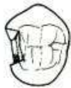
Cavidade de cl. ___