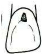
Cavidade de cl. ___

De acordo com a classificação de Black para as cavidades, assinale a alternativa que contém a seqüência correta. (Imagens Prof. Dr. Fernando Mandarin)