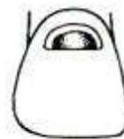
Cavidade de cl. ___