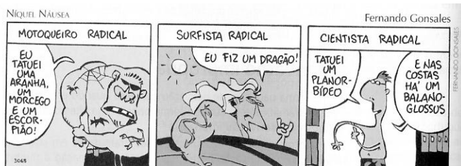
GONSALES, Fernando. Niquel Náusea — Botando os bofes de fora . São Paulo: Devir, 2002. p. 43.

planorbídeo: molusco gastrópode de água doce. balanoglossus: protoctólido vermiforme cosmopolita marinho.