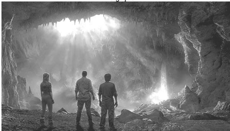
No coração do planeta Cena do filme Viagem ao Centro da Terra , de 2008. O fascínio de um mundo desconhecido sob nossos pés

Em Viagem ao Centro da Terra , o clássico de Júlio Verne, um grupo de aventureiros desce por uma fenda na crosta terrestre e encontra um mundo inteiramente novo, dentro de um espaço vazio existente no centro do planeta. Nesse universo subterrâneo há ilhas, um oceano e até um sistema misterioso de iluminação. O francês Verne, que morreu em 1905, escreveu sobre viagens ao fundo do mar, à Lua e pelos ares muito antes que o submarino moderno, o foguete e o avião fossem inventados. Agora parece que ele também estava correto, pelo menos em parte, sobre a existência de um mar no interior da Terra. Um estudo produzido por cientistas da Universidade Estadual do Oregon, nos Estados Unidos, divulgado na quinta-feira passada, sugere a existência de grandes quantidades de água entre 250 e 650 quilômetros abaixo da crosta terrestre. Não são lagos nem cascatas encantadoras como os da ficção científica de Verne. Mas, de qualquer forma, a pesquisa revela a presença de água em profundidades antes inimagináveis.