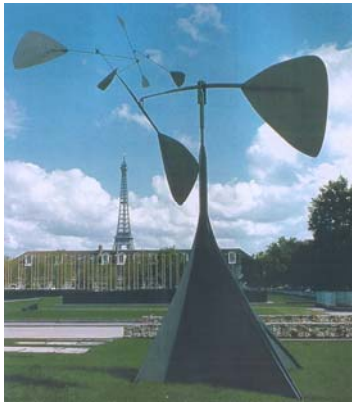
Alexandre Calder - A espiral

Essas duas imagens nos mostram duas obras de arte colocadas em lugares públicos, são elas: