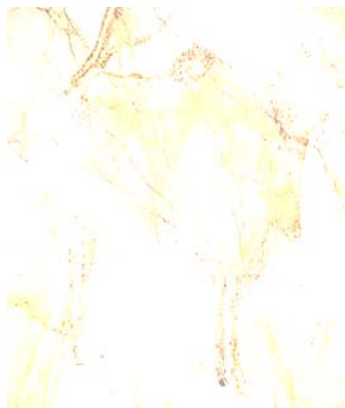
Bisonte: grutas de Lascaux