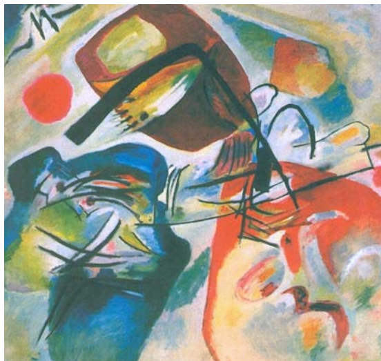
Com o arco negro Wassily Kandinsky, 1912

No início do século XX apareceram diversos movimentos artísticos em que se dispensava a representação de objetos e de temas da natureza, de maneira clara. A renúncia à figura era o caminho necessário para alcançar uma pintura pura. Wassily Kandinsky, foi o pioneiro desse movimento, que tem nomes como Piet Mondrian, Malevitch entre seus primeiros representantes. Observe a reprodução da obra que representa muito bem este estilo de pintura e assinale a resposta correta .