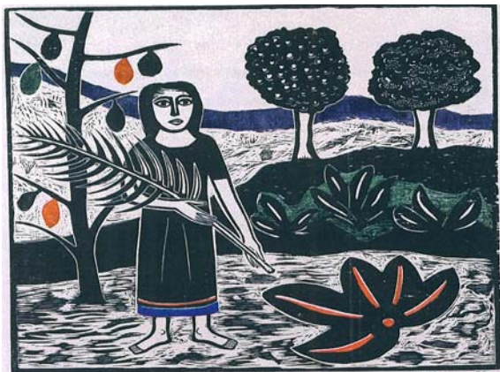
A virgem da palma – Samico

Observe a imagem da gravura e identifique a técnica utilizada, assinalando a resposta correta .