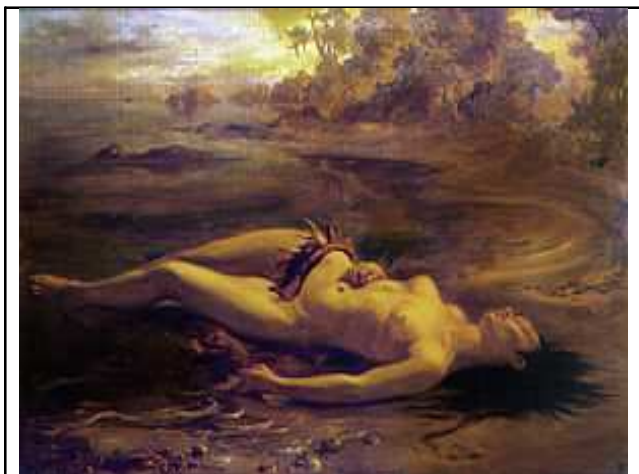
Moema , 1866, Victor Meirelles. Óleo sobre tela, 129 x 190 cm. Museu de Arte de São Paulo. Disponível em: http://www.dezenovevinte.net/bios/bio_vm_arquivos/vm_moema.JPG . Acesso em: abr. 2010.

Essa pintura, de 1866, foi produzida por Victor Meirelles, pintor brasileiro, ligado aos círculos imperiais. A estética, o tema e o personagem escolhidos pelo artista indicam que a pintura é uma expressão do