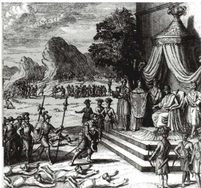
O mani Congo recebendo comerciantes e representantes do rei de Portugal. (In: Marina de Mello e Souza, p 40)

(Marina de Mello e Souza. África e Brasil Africano . São Paulo: Ática, 2006, p. 32)