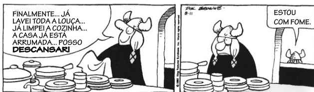
(Dik Browne. O melhor de Hagar, o horrível . Adaptado)

Leia os quadrinhos para responder às questões de números 10 e 11.