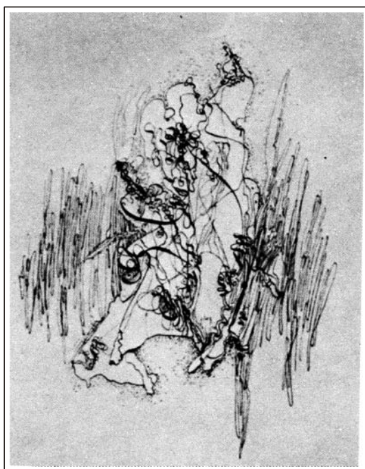
Hans Hartung, Desenho , 1957