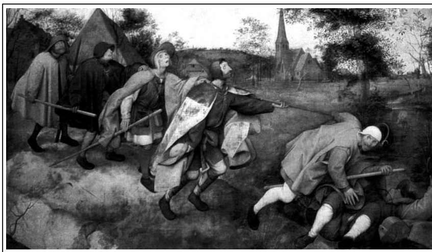
Pieter Bruegel. A Parábola dos Cegos , 1568

Sobre o processo de criação de figuras-cênicas pelos alunos-atores, a partir da intersecção de um quadro A Parábola dos Cegos , de Bruegel (apresentado abaixo), e o texto teatral Os Cegos , de Ghelderode, Mirna Spritzer, em O ator e a visualidade: uma experiência com alunos-atores propõe o quadro de Bruegel como um recurso visual para