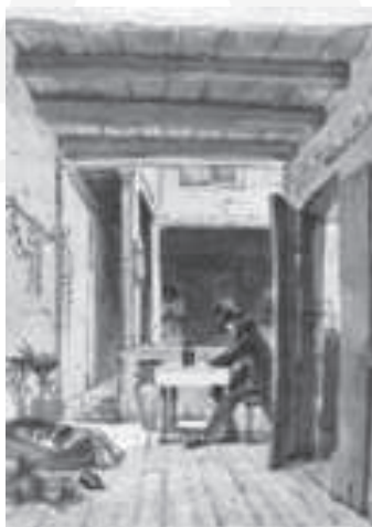
O castigo de escravos