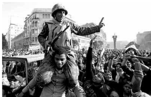
Clima nas ruas do Egito foi de grande festa durante todo o sábado [12.02.2011]; manifestante carrega soldado no Cairo