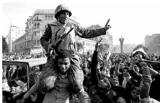
Clima nas ruas do Egito foi de grande festa durante todo o sábado [12.02.2011]; manifestante carrega soldado no Cairo