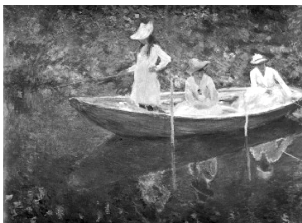
Claude Monet, Barco em Giverny, cerca de 1887 Pintura a óleo sobre tela.