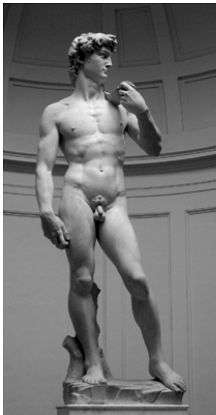
Michelangelo, David, 1501-1504, 5,17m de altura, escultura em mármore.