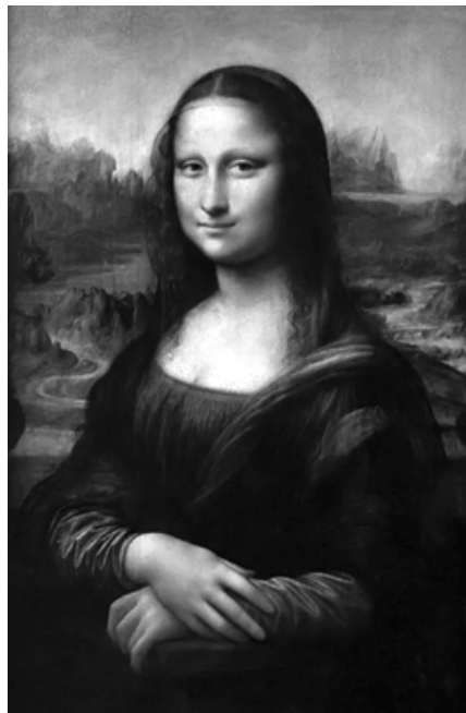
Leonardo da Vinci, Mona Lisa, cerca de 1502. Pintura a óleo sobre madeira.77cm. x 53 cm.