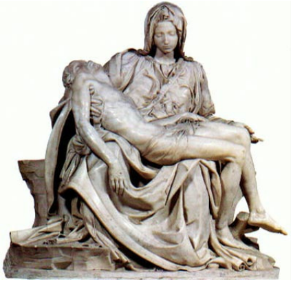
Pietà (1499), Basílica de São Pedro, Vaticano, Roma