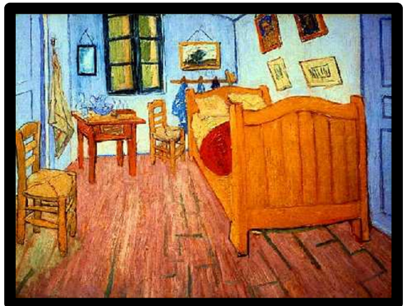
O Quarto do Artista em Arles (outubro, 1888), Óleo sobre tela.

11. Dois anos após ter chegado à França, parte para a cidade de Arles, no sul do país, uma região rica em paisagens rurais. Na mesma época convidou Paul Gauguin para morar com ele. Para recebê-lo, fez uma reforma em seu quarto. O desejo do artista ao planejar o ambiente, foi de transmitir uma sensação familiar e acolhedora.