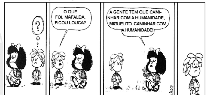
QUINO. Toda Mafalda . São Paulo: Martins Fontes, 2000. p. 95.

06. Considere a charge abaixo e assinale a alternativa correta.