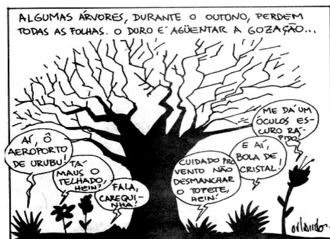
Orlando. Folha de S. Paulo, 26/5/1994.

7) As vírgulas presente no primeiro período podem ser substituídas sem alteração de sentido gramatical por: