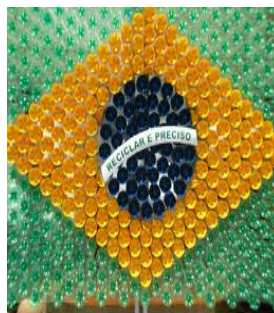
E) Bandeira de Bolinhas.