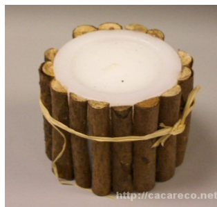
D) Vela Decorativa;