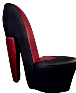
C) Poltrona Contemporânea;