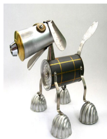
B) O Cachorro de Lata;