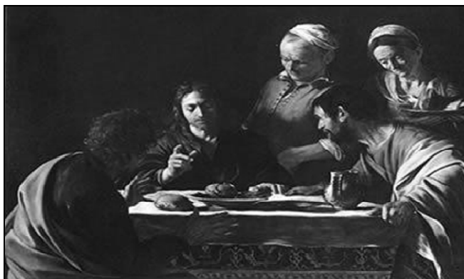
( http://www.mundoeducacao.com.br/literatura/barroco.htm )

A ceia em Emaús (1600-1601), de Caravaggio , retrata o momento em que Jesus se apresenta a seus discípulos, após a Ressurreição.