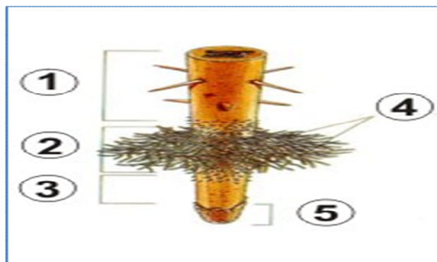
Figura 01 – morfologia externa de uma raiz.

21) Com base na morfologia externa de uma raiz (Figura 01), assinale a alternativa que demonstra a sequência CORRETA :