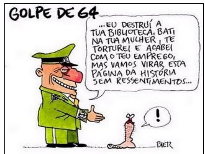
Revista Carta Capital de 28 de dezembro de 2011

(Adaptado da revista carta capital, Ed. Especial)