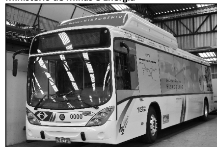
Veículos limpos não poluem e nem fazem barulho

( http://www.brasil.gov.br/sobre/ciencia-e-tecnologia/tecnologia-de-ponta/veiculos-limpos – Adaptado)