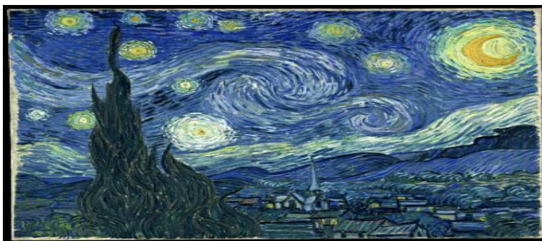
Artista: Vicent Van Gogh , 1889.

Sobre a obra, assinale as alternativas verdadeiras: