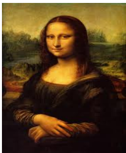
d) Autor: Da Vinci.

15. Elemento visual que esboçado num papel ou qualquer outro suporte, imediatamente melhor transmite a ideia de movimento: