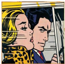
b) Autor: Roy Liechtenstein.