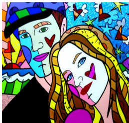
c) Autor: Romero Britto.