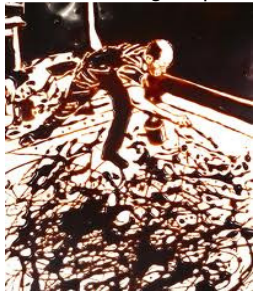
a) Autor: Vik Muniz.