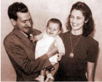
Eu e meus pais, em 1942.