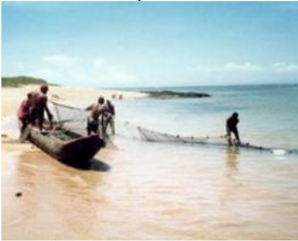
Pesca de arrastão em Manguinhos.

Meu nome é Ana Maria Machado e eu vivo inventando histórias. E dessas que eu escrevo, algumas viram livros. Adoro o meu trabalho. Ainda bem, porque acho que não ia conseguir viver se não escrevesse. Já fui professora, já fui jornalista, já fiz programa de rádio, já tive uma livraria e nesse tempo todo nunca parei de escrever.