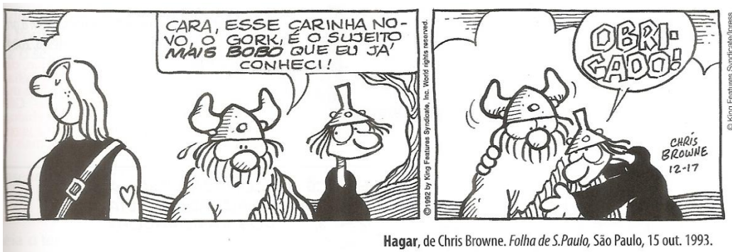
Hagar, de Chris Browne. Folha de S.Paulo, São Paulo, 15 out. 1993.

Leia este diálogo entre Hagar e seu amigo Eddie Sortudo e assinale a afirmação INCORRETA: