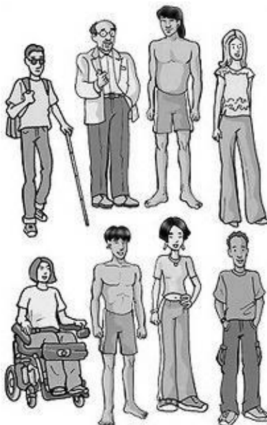
Disponível em: < http://georuyzao.blogspot.com.br/p/etica-e-cidadania.html >

Ela representa o trabalho executado por ONG's com diferentes segmentos da sociedade, objetivando construir uma cidadania com base na ética