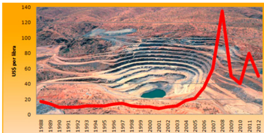
Evolution of Uranium Prices