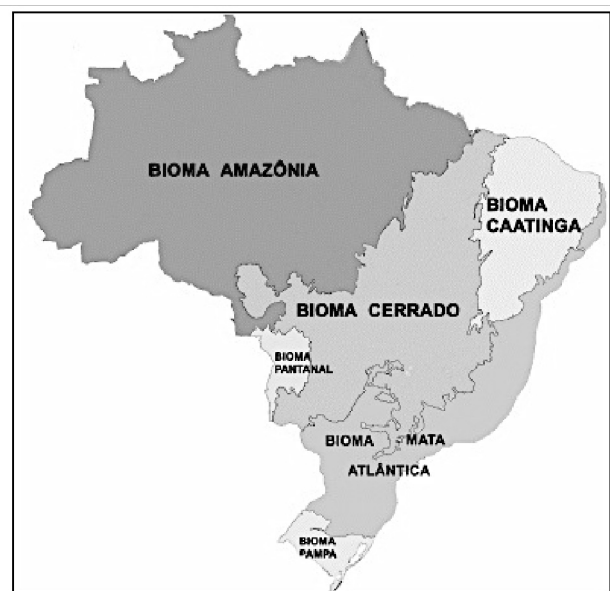
( http://www.ibge.gov.br/home/presidencia/noticias/21052004biomashtml.shtml )

Com relação aos biomas brasileiros representados no mapa acima, assinale V para a afirmativa verdadeira e F para a falsa.