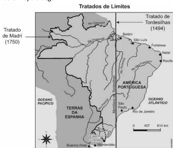
RESENDE, Maria Efigênia Lage; MORAES, Ana Maria. Atlas Histórico do Brasil. Belo Horizonte: Vigiã, 1987, p.35. (Adaptado)

Assinale a alternativa que descreve corretamente a consolidação do território português na América, de acordo com os tratados assinalados no mapa acima.