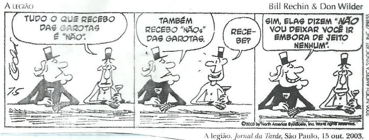
A legião. Jornal da Tarde , São Paulo, 15 out. 2003.

O vocábulo “NÃOs” no segundo quadrinho é um exemplo do seguinte processo de formação das palavras: