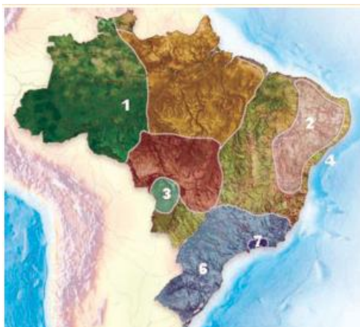
Figura: A distribuição das regiões que sofrerão os impactos das Mudanças Climáticas.