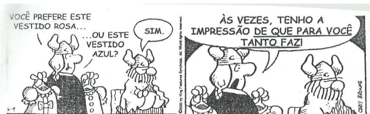
BROWNE, Chris. Hagar. Folha de S. Paul