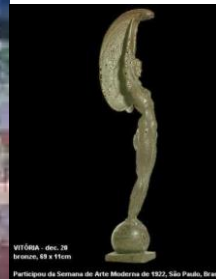
Brecheret Vitoria ,1922