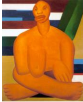
A negra - 1923 A Negra 1922 Tarsila do Amaral

30. Na década de 20, anos pioneiros do Modernismo, artistas como Tarsila do Amaral, Brecheret e Di Cavalcanti expressaram em suas obras a visão de mundo daquele período. Observe as reproduções a seguir respectivamente , de Tarsila do Amaral, Brecheret e Di Cavalcanti, e assinale a alternativa que corresponde aos conteúdos expressos pelos artistas.