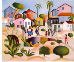
Morro da favela - 1925 Morro da Favela 1925