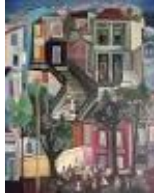
Noturno na Gamboa E. di Cavalcanti (1897-1976)