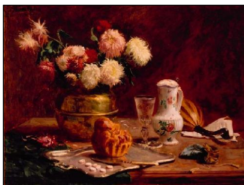
(Pedro Alexandrino – Flores e doces – 1899. Óleo sobre tela. Pinacoteca do Estado de São Paulo 87 x 115 cm.)