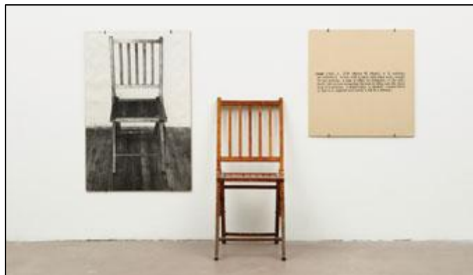
(Joseph Kosuth - Uma e três cadeiras – 1965. Disponível em: http://noticias.universia.com.br .)

“Kosuth criou a obra ‘Uma e três cadeiras’, em 1970, em que são apresentadas três formas de cadeiras: a dobrável, a comum; uma fotografia em prata coloidal de uma cadeira e a imagem ampliada de uma definição de algum dicionário sobre a palavra ‘cadeira’. Para o autor, a expressão da obra estava na ideia, e não na forma.”